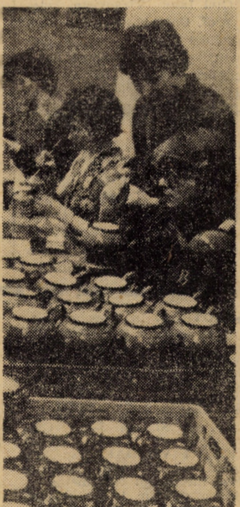
În atelierul finisat al întreprinderii „Emailul roșu” Mediaș, o parte din producția de vase emailate trece prin miinile talentaților pictori în vederea aplicării manuale a modelelor decorative.