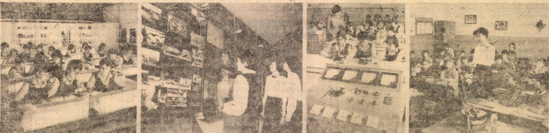
Imagini care vorbesc elocvent despre atributele esențiale ale învățămîntului românesc contemporan: bază materială modernă, calitate și eficiență la Liceul pedagogic din Sibiu