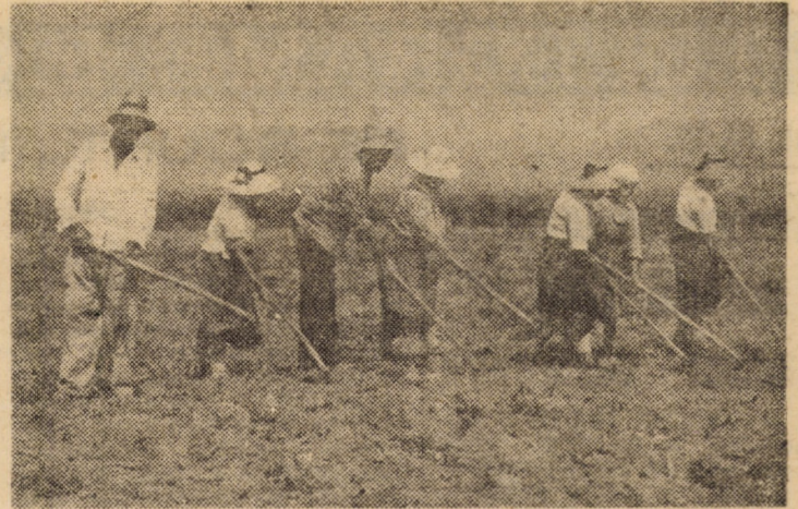
Pe ogoarele C.A.P. Scorei, membri cooperatori execută prașila I manuală la porumbul pentru boabe, lucrare deosebit de importantă pentru conservarea rezervelor de apă din sol

La întreprinderea „Flamura roșie” Sibiu se folosește în