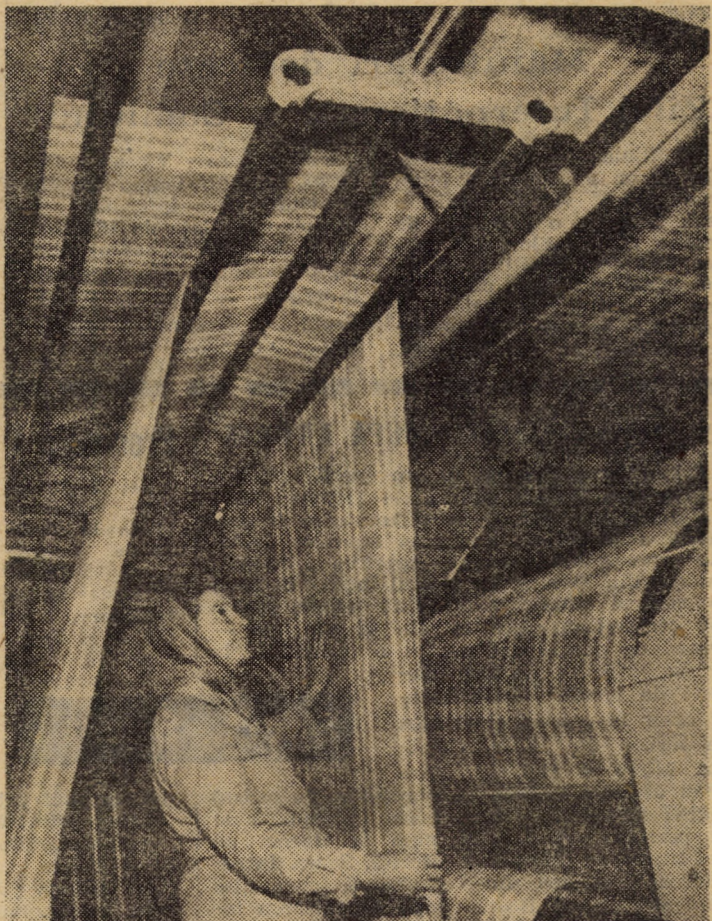
Păturile sub formă de țesături — metraj, produse la întreprinderea „Progresul” din Orlat, sint trecute în final printr-un amplu proces de finisare, realizat cu ajutorul unor utilaje complexe