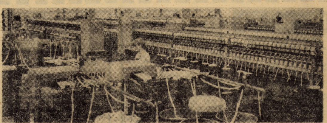
Vă redăm o imagine din moderna filatură a întreprinderii „11 Iunie”, Cîsnădie