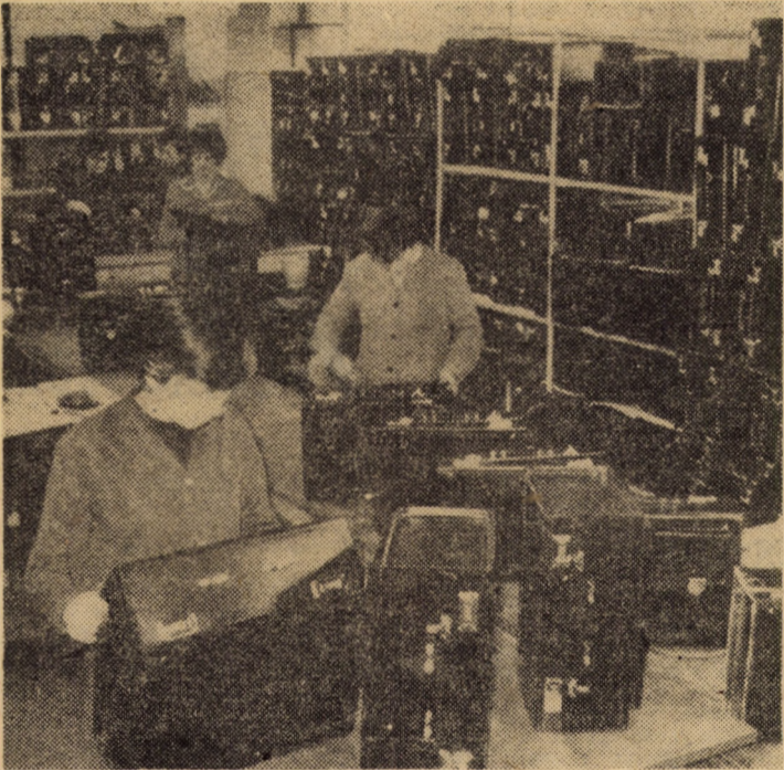
„13 Decembrie” Sibiu; articolele de marochinărie purtînd marca întreprinderii sînt deosebit de apreciate pe piețele multor țări din lume

(Continuare în pag. a III-a) Ion SORESCU