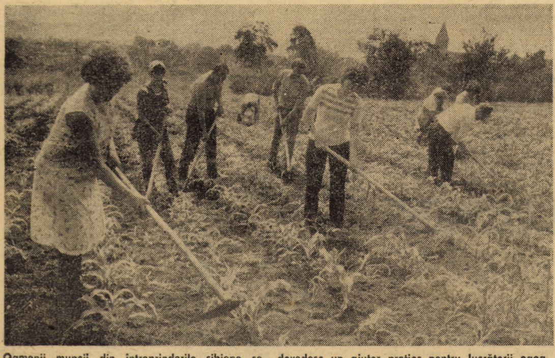
Oamenii muncii din întreprinderile sibiene se dovedesc un ajutor prețios pentru lucrătorii ogoarelor, la executarea lucrărilor de întreținere a culturilor prașitoare. În imaginea de față muncitorii de la Întreprinderea de morărit și panificație din Sibiu lucrează la prașila porumbului pe terenurile C.A.P. Sibiu