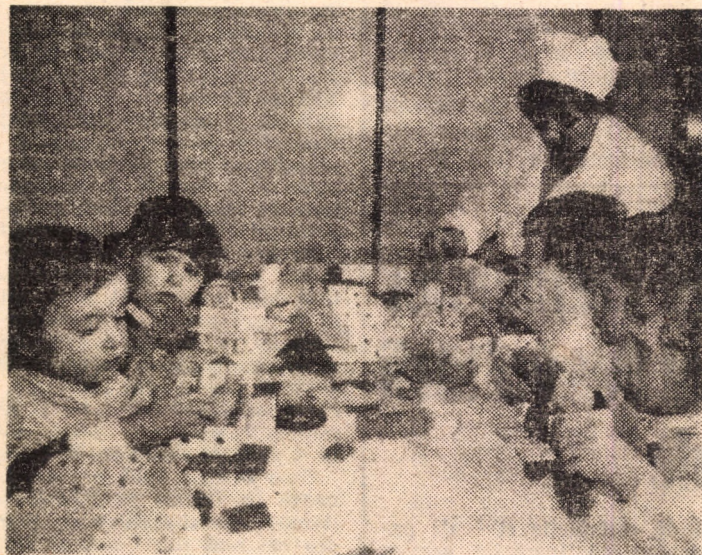
În creșe și grădinițe, grija pentru educarea și formarea deprinderilor celor mici este o permanență în activitatea personalului sanitar și a educatoarelor