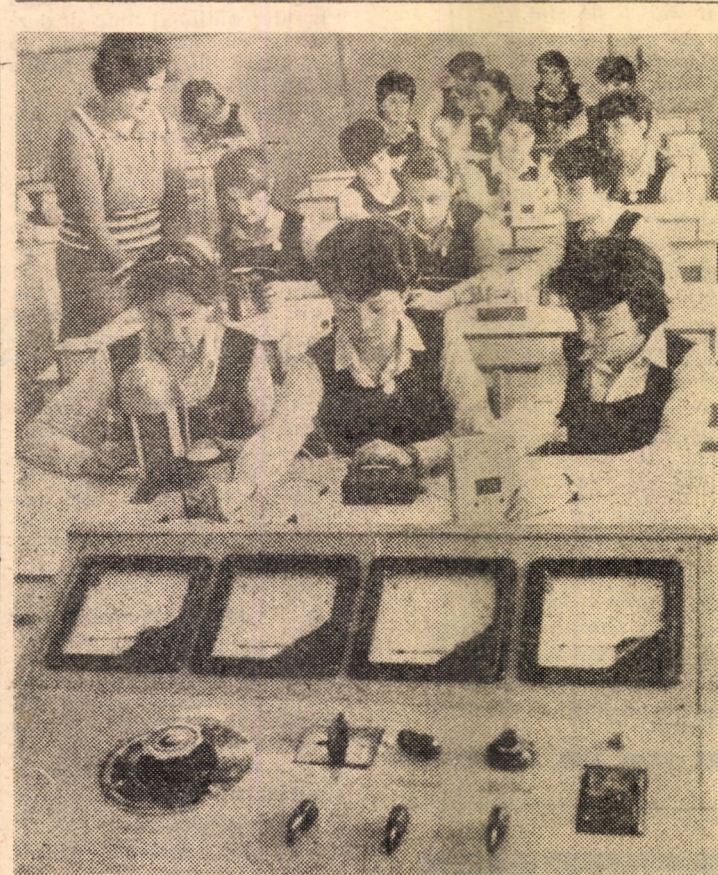
La Liceul pedagogic din Sibiu există laboratoare de specialitate cu o dotare corespunzătoare cerințelor învățămîntului modern.

Deci, mîine, finala mică — Franța — Belgia. (n.i.d.)