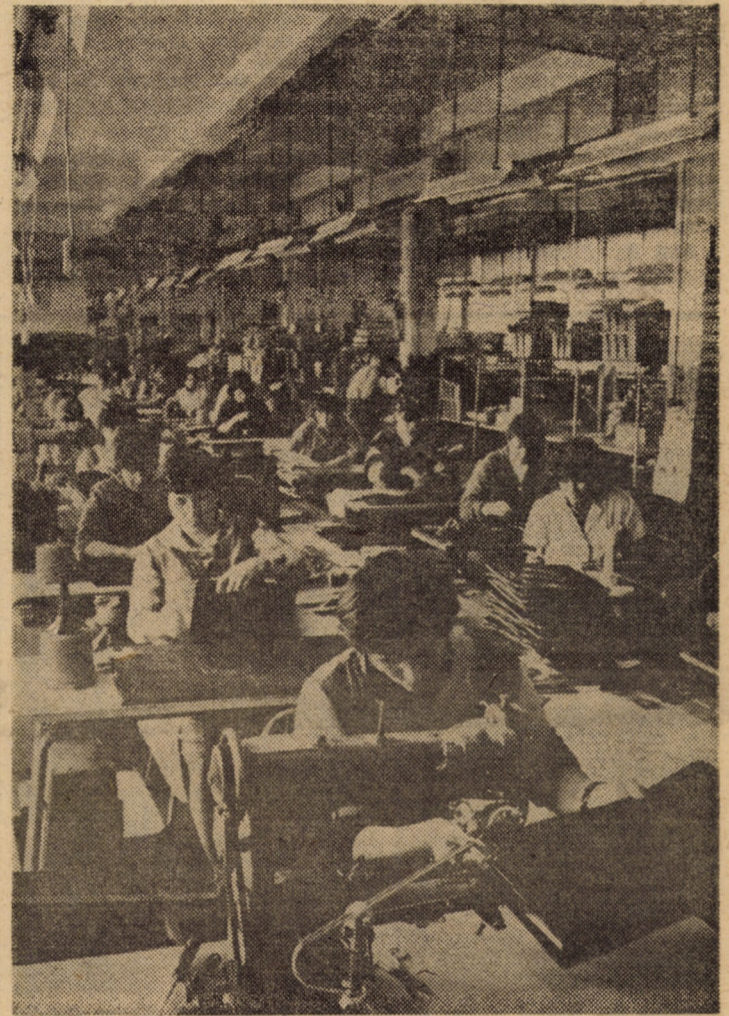
Printre unitățile industriale sibiene bine cunoscute atît în țară cît și peste hotare, și ale cărei produse, îndeosebi cele de marochinărie, sînt foarte mult apreciate de beneficiari, se numără și întreprinderea „13 Decembrie” Sibiu, de unde vă prezentăm o linie tehnologică de mare productivitate

Au fost abordate, de asemenea, unele aspecte ale vieții internaționale. A fost subliniată contribuția pe care parlamentele o pot aduce la încetarea cursei înarmărilor și trecerea la dezarmare, în primul rînd la dezarmarea nucleară, la oprirea amplasării de noi arme în Europa, asigurarea păcii, securității și destinderii pe continentul nostru, în regiunea Mediteranei și în întreaga lume, soluționarea pe cale politică, prin tratative, a stărilor de încordare și conflict, instaurarea unei noi ordini economice mondiale.