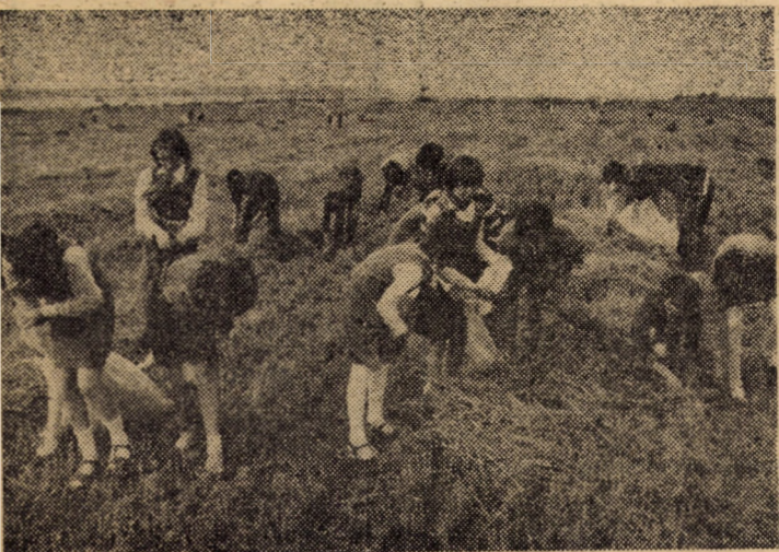
În aceste zile, un mare număr de elevi din școlile județului participă la stringerea spicelor rămase în urma combinelor

3,05 aptă- su- i de lodii dese- sem- entei muncii nucul nuita — ograf Iunie men- 19,00 Din dra- tință. știnut onier- milor ale țional âniei” eleen- color). tistic: color). urnal. e aur (co- Pacea: ele 9; 15,45; „Al lingă orele 16; a 18 ru a- etului: orele „Alo, ăbun- și 20. „Con- te 10; Nolem- ne”, o- 18; 20. Pro- se în- le 9; 15,45; Central: 9,30; 18; 20. e: „Pas 10; 14; „Co- scoaze”, 18; 20. Kramer er”, o- 19. CĂ: prele 16 IULUI: zestre”, prele 16 ie rală nr. artistic ganizea- pentru a artă muzică (flaut, fagot, ereuție). avea VII.a.c., liul șco- dobescu 1 45 80) IOVICA) va în- Cercul il. Izolat sibile a- le ploaie. infla slab lin nord- peraturile fi cu- 11 și 13 le maxi- 12 și 24