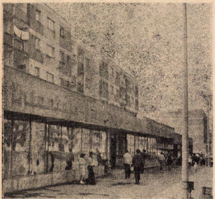
Imagine din tinărul cartier de locuințe „Vitrometan” din municipiul Mediaș.