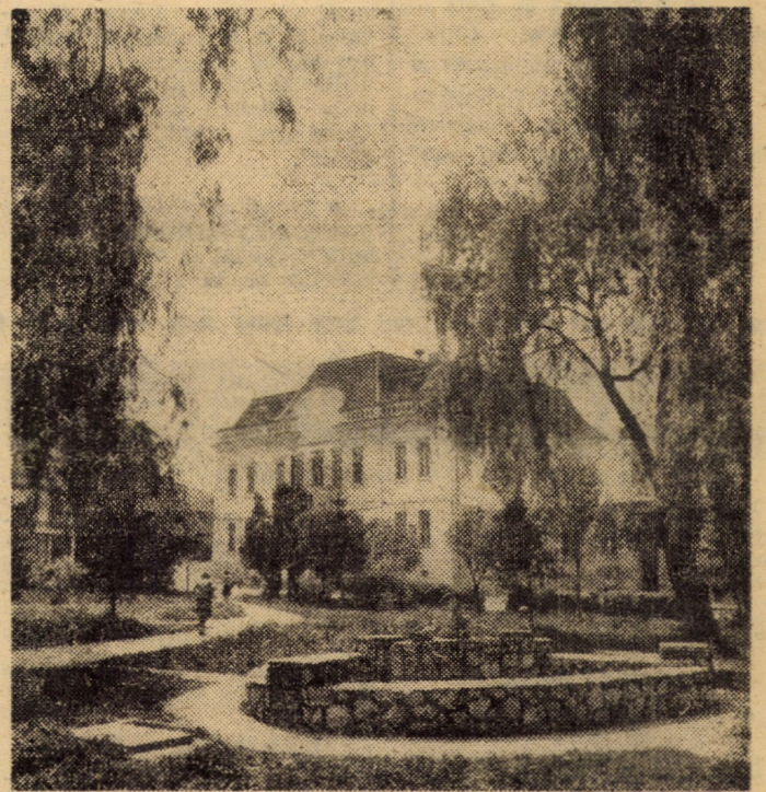
Ilustrată din centrul civic al orașului Ocna Sibiului, localitate în care preocuparea cetățenilor pentru înfrumusețare și buna gospodărire este mereu în actualitate.

ale acestor influențe negative, fie din partea unor adulți, fie din partea altor minori vicioși cu care vin în contact. În anul 1985 și în primele luni din acest an, cadrele miliției județene au întreprins un complex de măsuri diversificate, o parte în colaborare cu ceilalți factori educaționali, în scopul prevenirii abaterilor și încălcărilor de lege comise de