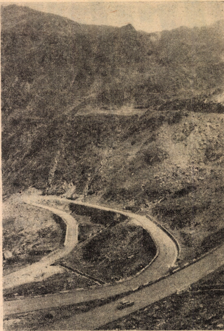
Din atrăgătorul peisaj al Văii Bilea, cu serpentinele drumului „Transfăgărășan”