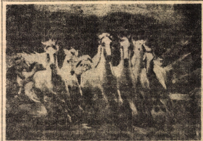
Dimineața la Simbăta — pictură (ulei) de Roman Milea

20,00 20,20 ecor 20,35 ma de c suri volu 20,45 IX- desc toar 21,00 lor) disp 21,50 SIB „Lanț două 11,45; la ora mină Tiner mir” „Provi nului” 17; 1 denț poate orele MEI gresul alertă 11,15; 20. C vârșă 11,30; I.L. C raju 16; 18 CIS fără z rii, or AGI col 1 16; 18 DUI „Chek rele I COI „Brac și 18. OCI „Inim 17 și de fo ora „Stu cult telor nize curs pent muz muz și de țară. Te Ager 11157 De v6 Auk 15752 C.E. C.F. 11450. Cine 11606 Tiner Dup forma lular ne, v coroa instai temp Vor cale fite s elect sufia nord. minis prins grade me grade