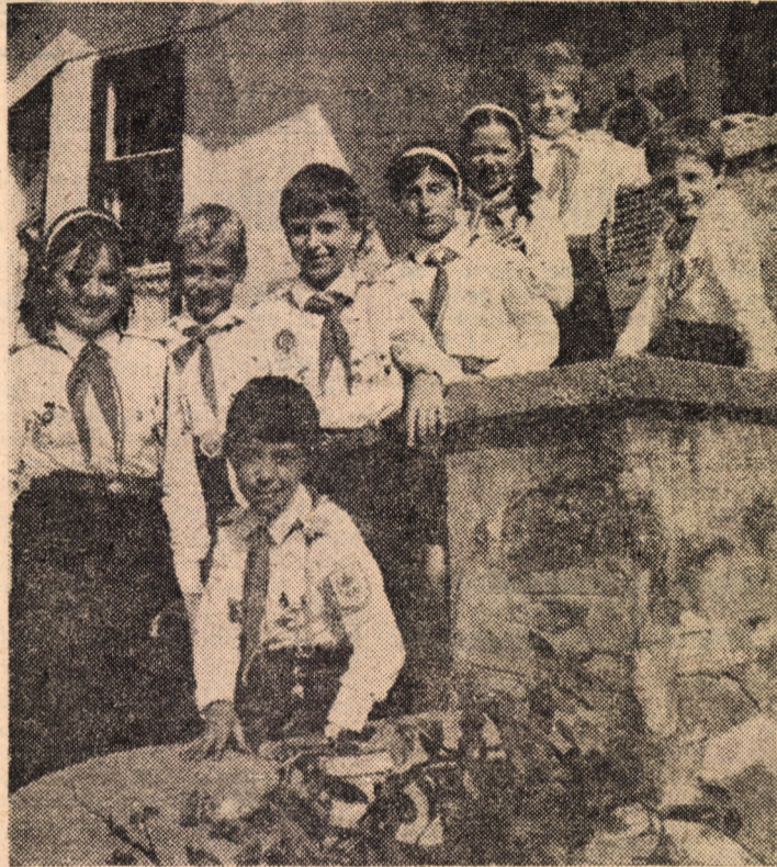
Copilărie fericită! Cum altfel am putea titra această imagine, care vorbește de la sine, prin candidul zîmbet al pionierilor, despre minunatele condiții de învățură, educație și recreere create de partidul și statul nostru tuturor copiilor patriei, în anii luminoși ai socialismului?