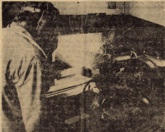
O metodă de mare eficiență, folosită cu bune rezultate la Centrul de reparații capitale de la Tirnava al Trustului S.M.A. Sibiu: Metalizarea axelor pentru arborele motor.