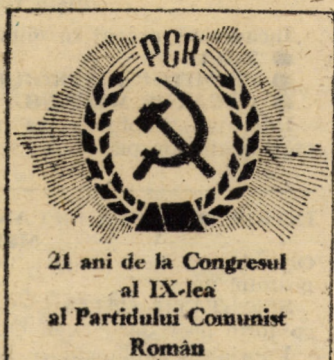
21 ani de la Congresul al IX-lea al Partidului Comunist Român

proces istoric de educație în și pentru muncă, de instruire profesională, dublată de o lărgire permanentă a orizontului cultural general, de însușire a științei, a concepției revoluționare despre lume. Numai în cadrul unui asemenea complex de măsuri obiective și subiective, omul se putea transforma el însuși, devenind un om înaintat, cu o înaltă conștiință umanistă și revoluționară, capabil să participe activ la viața socială, la construcția istorică a noii societăți.