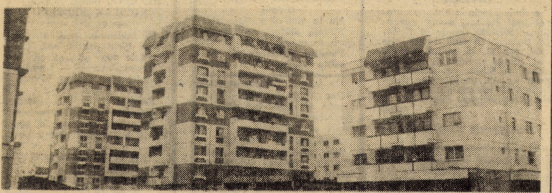
Noile blocuri P+8 cu partere comerciale, ridicate în ultima perioadă în cartierul Valea Aurie, atribuie acestei zone sibiene o înfățișare arhitectonică atractivă

Or, fapte ca cele de mai sus sînt aspru sancționate. Decretul Consiliului de Stat nr. 306 din 9 octombrie 1981, privind măsuri pentru prevenirea și combaterea unor fapte care afectează buna aprovizionare a populației, la Art. 5 prevede: „Constituie infracțiune și se pedepsește cu închisoare de la 6 luni la 5 ani, dacă legea nu prevede o pedeapsă mai mare, sustragerile sub orice formă din avutul obștesc de produse agricole de pe cîmp, din mijloacele de transport, din locurile de depozitare ori de desfacere”. De aceea, organele în drept sînt chemate să acționeze fără nici o rezervă, să sancționeze exemplar pe cei ce nesocotesc avutul obștesc. (I.F.)