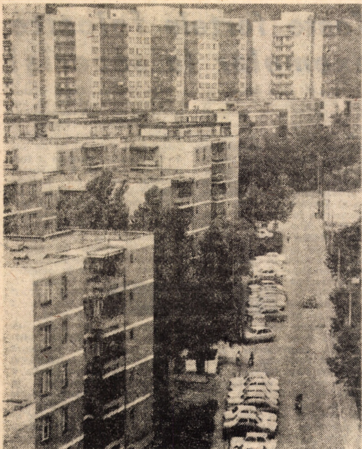
Imagine simbol pentru dezvoltarea pe verticală a Mediașului

Permanenta grijă a conducerii partidului și statului nostru pentru cetățenii României socialiste rezidă și din ambițioasele prevederi ale actualului cincinal. Iată doar câteva din obiectivele ce se vor finaliza în cel de-al 8-lea cincinal în județul Sibiu: ● se vor construi 9 750 apartamente ● 14 școli cu 228 săli de clasă ● două cinematografe cu 850 locuri ● 4 dispensare medicale ● o policlinică ● prestările de servicii vor spori cu 44,5 la sută în 1990 față de 1985, cu un ritm mediu anual de 7,7 la sută ● desfășurările de mărfuri către populație vor crește în aceeași perioadă cu 15,8 la sută, ritmul mediu anual fiind de 3 la sută ● în municipiul Mediaș se va construi un modern magazin universal; se va introduce transportul în comun cu troleibuzul, se va îmbunătăți alimentarea cu apă potabilă etc.