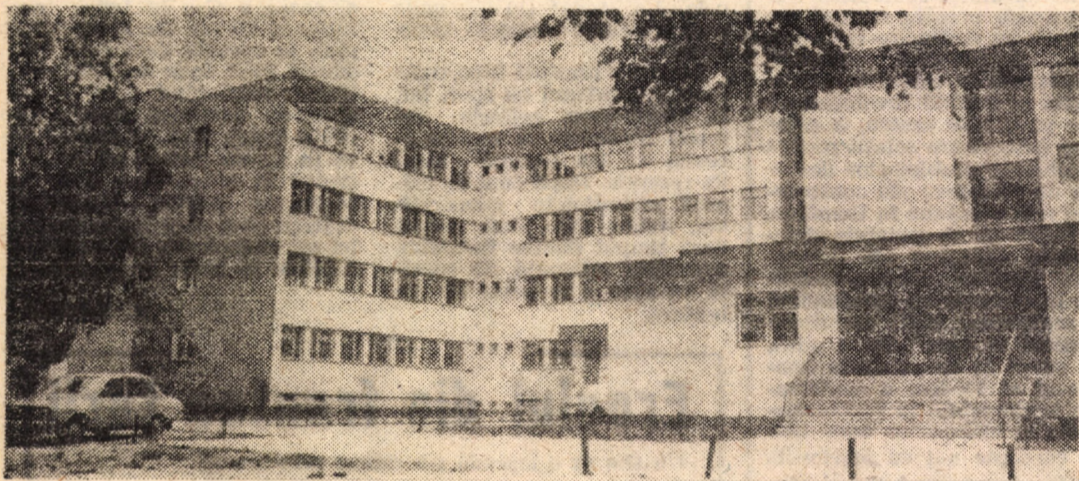
Spitalul de neuropsihiatrie infantilă și Secția de recuperare infantilă din Sibiu — recent date în folosință