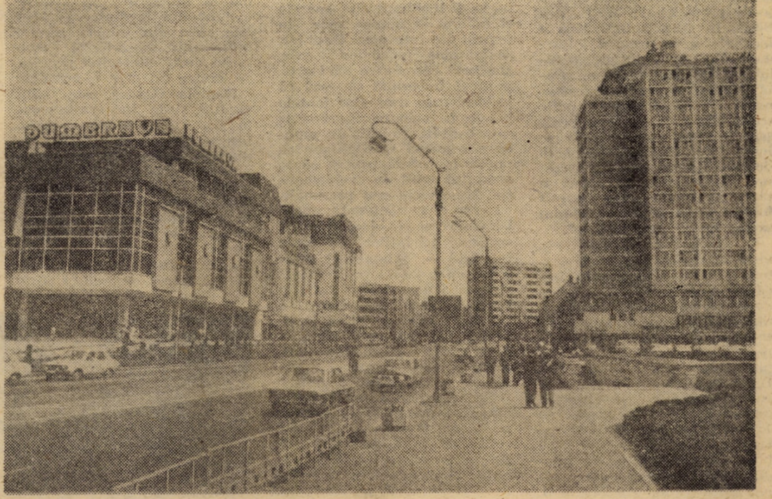
Semnele prefacerilor înnoitoare și-au pus definitiv amprenta și pe municipiul reședință de județ de pe Cibin, care, asemeni tuturor localităților țării, a cunoscut o amplă și rapidă dezvoltare economică și social-culturală în anii care au trecut de la Congresul al IX-lea al Partidului Comunist Român