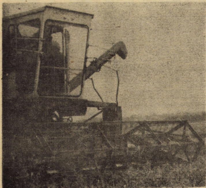
Ritmul secerișului mult îmbunătățit — o sarcină importantă pentru realizarea căreia se cere folosirea exemplară a fiecărei ore bune de lucru.

● Griul a fost recoltat de pe 4895 hectare ● 19 iulie a fost o zi record la seceriș ● Cerințe prioritare: folosirea integrală a zilei lumina la secerat și creșterea productivității pe combină ●