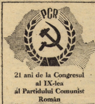
21 ani de la Congresul al IX-lea al Partidului Comunist Român