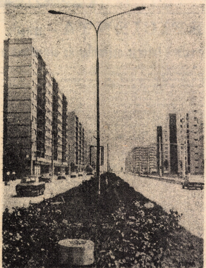
Contururile arhitectonice noi, ale municipiului Sibiu vorbesc cu argumentul faptei împlinite despre înnoirile urbanistice ale tuturor localităților țării în anii care au trecut de la cel de al IX-lea Congres al partidului