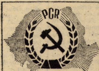
21 ani de la Congresul al IX-lea al Partidului Comunist Român