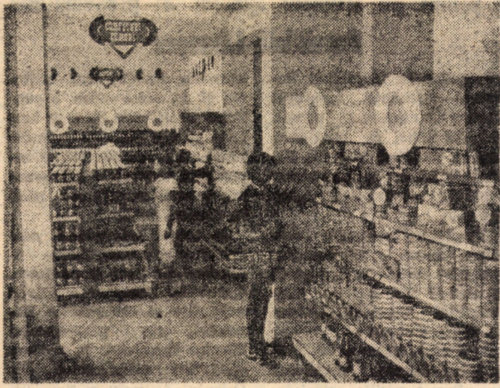
Vă prezentăm o vedere parțială a magazinului alimentar cu autoservire, amplasat la întretărirea străzilor Lomonosov — Școala de înot din Sibiu.