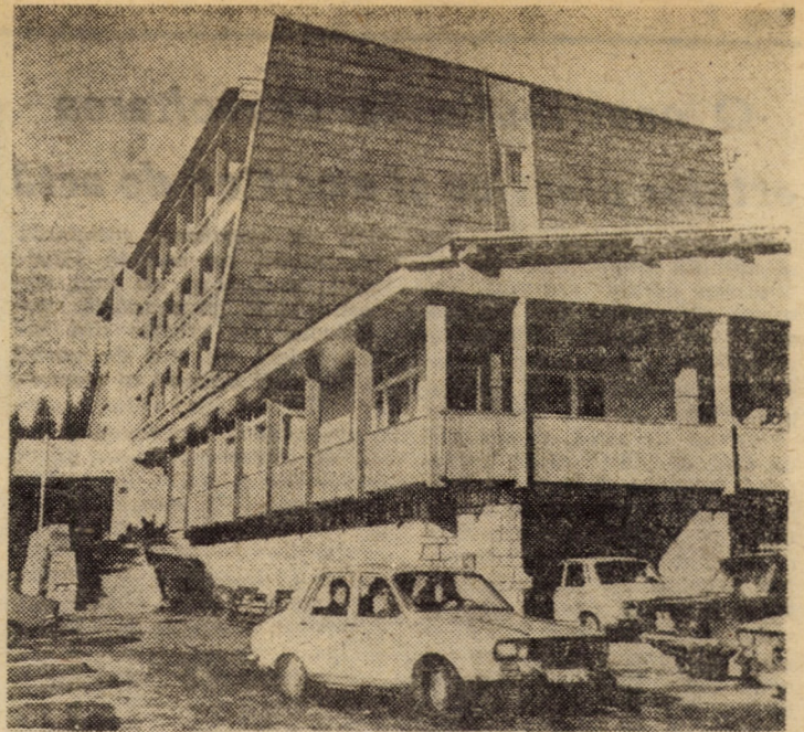
Hotelul „Cindrelul” — unitate reprezentativă a stațiunii climatice Păltiniș