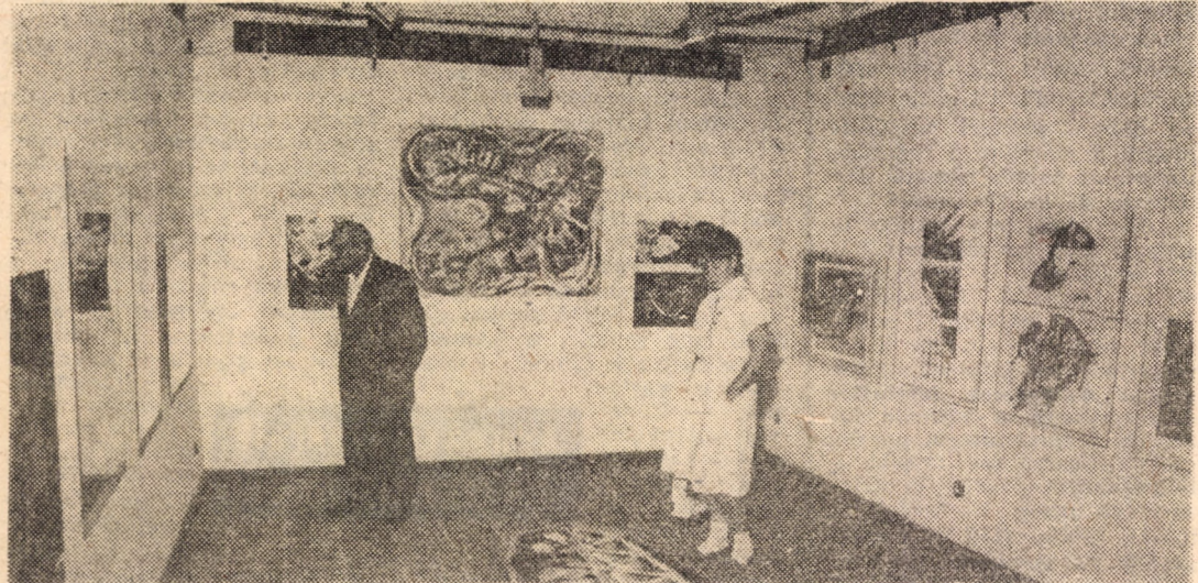
Imagine din expoziția colectivă deschisă la Galeria Sirius

tiple de rezolvare, originalitatea fiind apreciată cu un punctaj dublat. I-am urmărit pe copii lucrând ore în șir la cite o problemă, luându-și conștiința și nerăbdători temele pentru a doua zi — afișate la gaza de perete a taberei — aplecându-se atenți asupra lor pentru a le rezolva cât mai corect. Se scrie pe caiete, pe foi de hirtie, pe table, chiar și... pe ușile de la club, pentru că nu sînt suficiente table, deocamdată. I-am văzut apoi, cu același neastimpărcopilar, netulburat de oboseala studiului, a concentrării, jucîndu-se în curtea taberei, făcînd sport, citînd, ascultînd muzică sau dansînd. Vă putem spune chiar că, propunîndu-le copiilor să-și alcătuiască ei înșiși programul unei zile de tabără, am inclus cu toții în el orele de matematică, rezolvarea de probleme distractive. Dovadă că pasiunea își găsește și în vacanță cadrul potrivit pentru a se manifesta, iar instrucția și educația pe care școala le dau pe parcursul unui an școlar pot fi continuate cu rezultate deosebite în timpul vacanței. Pe tulburător de frumoasa vale a rîului Sadu, zborul tînr și culezător al unor copii minunați și dăruirea unor dascăli inimoși ne-au dovedit că, acolo unde ea există, pasiunea nu are vacanță. Doina TIMAR