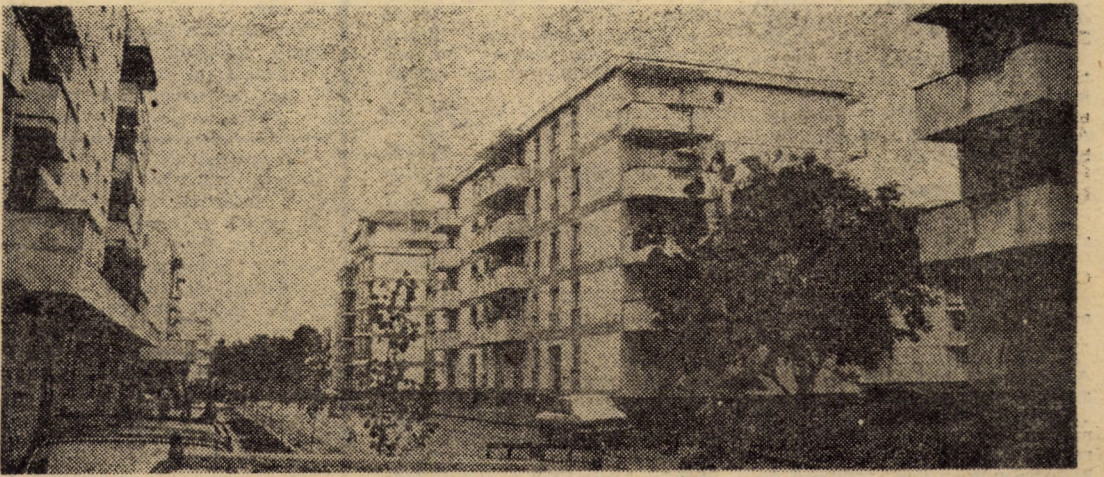
Printr-o arhitectură adecvată, prin spațiile comerciale de care dispune, tinărul cartier de locuințe „Valea Aurie” din Sibiu rivalizează pe zi ce trece cu oricare din noile cartiere ale municipiului

Pe marginea articolului „Scuzele nu pot înlocui... recolta” publicat în ziarul nostru din 27 iulie, primim următorul răspuns din partea Direcției generale pentru agricultură a județului Sibiu: „Urmare a articolului dv. privind cultura de fasole boabe a C.A.P. Broșteni, vă comunicăm că am verificat cele semnalate și am constatat că într-adevăr această situație se datorează lipsei de preocupare din partea conducerii unității pentru întreținerea acestei culturi. În consecință, am dispus sancționarea celor vinovați și, după încheierea recoltatului, imputarea diferenței de producție între ceea ce a fost evaluat și ceea ce se va obține în final. Vă mulțumim pentru sprijin”. Semnează: Director general, ing. Iosif Tutulea.