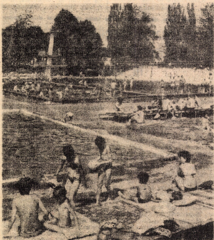
Zile fierbinți de august, pentru care strandul din strada Vasile Cârlova își alinaza întreaga gamă de ispite: răcoarea apei, arșița nisipului, serviciile unui bufet bine aprovizionat