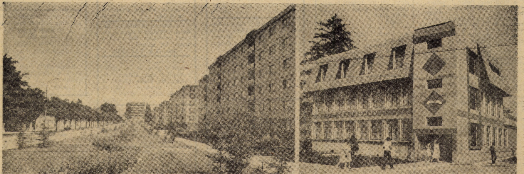
Printre străzile cuprinse în zonele de sistematizare ale municipiului Sibiu figurează și str. Școala de înot de unde vă redăm imaginea de mai sus.

Pagină realizată de Nicolae IVAN