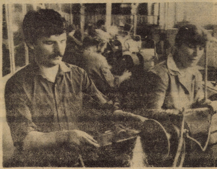
La I.U.P.S. Sibiu, prin reamplasarea unor utilaje, s-a creat o linie centralizată de ascuțit scule placate. Reorganizarea acestor locuri de muncă a condus la o mai mare eficiență în producție.