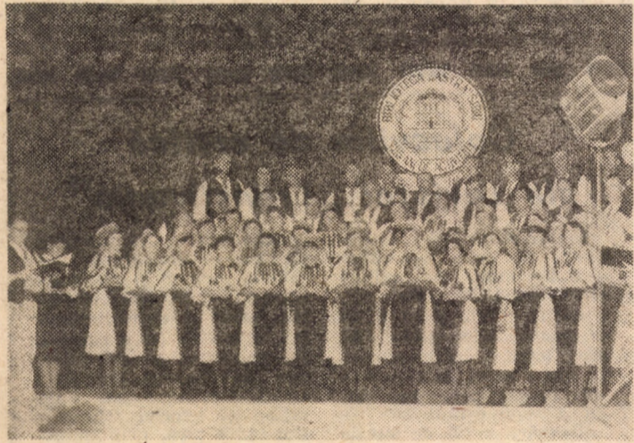
„Reuniunea de cîntări din Săliște“ la serbarea Bibliotecii „Astra“