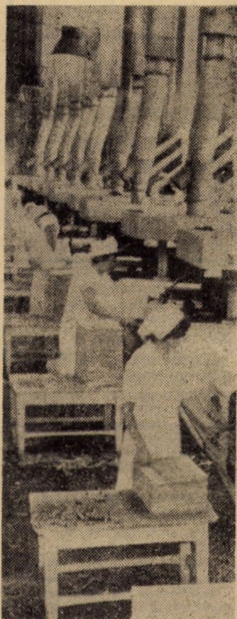
Secvență de lucru din hala cuptoarelor de la întreprinderea „Victoria” din Sibiu

Ca o concluzie, putem afirma că la I. M. Mîrșă se desfășoară în prezent o adevărată campanie de căutare de noi soluții, căi și mijloace de antrenare a tuturor cadrelor tehnico-ingenerești în activitatea de creație tehnică, cerîndu-li-se să-și manifeste și mai viguros inventivitatea, să-și sporească capacitatea de mobilizare și de acțiune, să dea dovadă de mai mult spirit de inițiativă, astfel încît să fie mereu cu un pas înaintea problemelor apărute în procesul de producție.