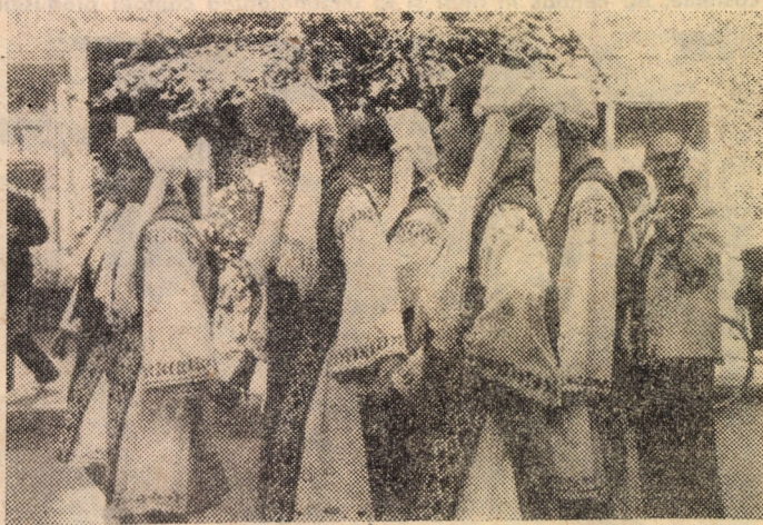
Din cadrul manifestărilor circumscrise săptămîinii culturale „Cibinium”, vă prezentăm o imagine de la Parada portului popular