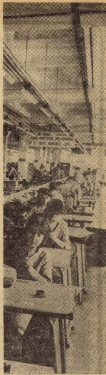
Linie de confecționat articole de marochinărie, cu deservirea locurilor de muncă, la unitatea din Săliște a întreprinderii „13 Decembrie” Sibiu