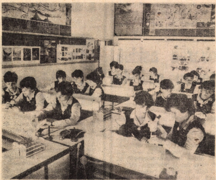
Liceul pedagogic din Sibiu dispune în prezent de laboratoare cu o remarcabilă dotare tehnică în care elevii beneficiază de excelente condiții de învățatură. În fotografie: aspect din laboratorul de biologie.

Prin renunțarea la desen, prin decantarea culorii către o unică gamă cromatică (devenită personală), Emanoil Drăghici Bărdaș, oferă în prezenta expoziție o elevată dovadă de transfigurare artistică a realității peisajului, adăugînd o bilă albă în aventura majoră a zilelor noastre — drumul spre arta autentică de pregnant mesaj umanist. M. BARBU