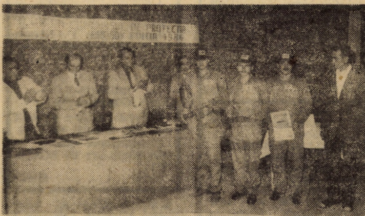
Aspect de la festivitatea de premiere a echipajului Fabricii de mecanică fină Agnita, cîștigător al locului II, la concursul de protecția muncii, faza pe centrală.

Timp de trei zile, în 9, 10 și 11 septembrie, Fabrica de mecanică fină din Agnita, aparținînd de I. M. Mîrșa, a fost gazda ospitalieră a concursului de protecția muncii, faza pe Centrala industriei de autocamioane și tractoare