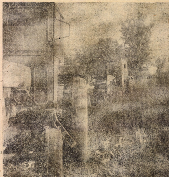
Nivelul buruienilor în terenul C.A.P. Șeica Mare în momentul în care plugurile au intrat la executarea arăturilor pentru însămînțări