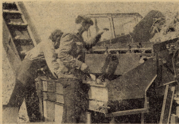
La C.A.P. Merghindeal porumbul recoltat este transportat în incinta unității unde se realizează operația de depănșat