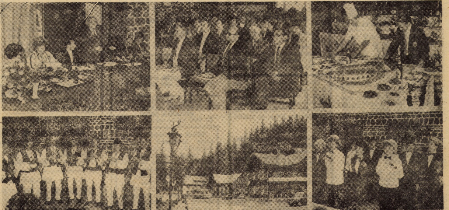
Aspecte de la manifestările din cadrul Consfătuirii pe țară a cabanierilor

● tuturor cabanierilor le revine sarcina imediată de a-și constitui gospodării-anexă proprie, din care să valorifice pentru turiști carne, ouă, lapte, zarzavaturi, fructe și alte produse agroalimentare proaspete și la prețuri accesibile ● toți factorii cu atribuții și, în primul rînd, cabanierii trebuie să concure la reactualizarea specificității (personalității) cabanei, atît în ceea ce privește oferta culinară — „mîncarea casei”, ceaiurile din flora zonei respective, dulciurile, tradiționale, siropurile din fructe de pădure etc. —, cît și cea de agrement.