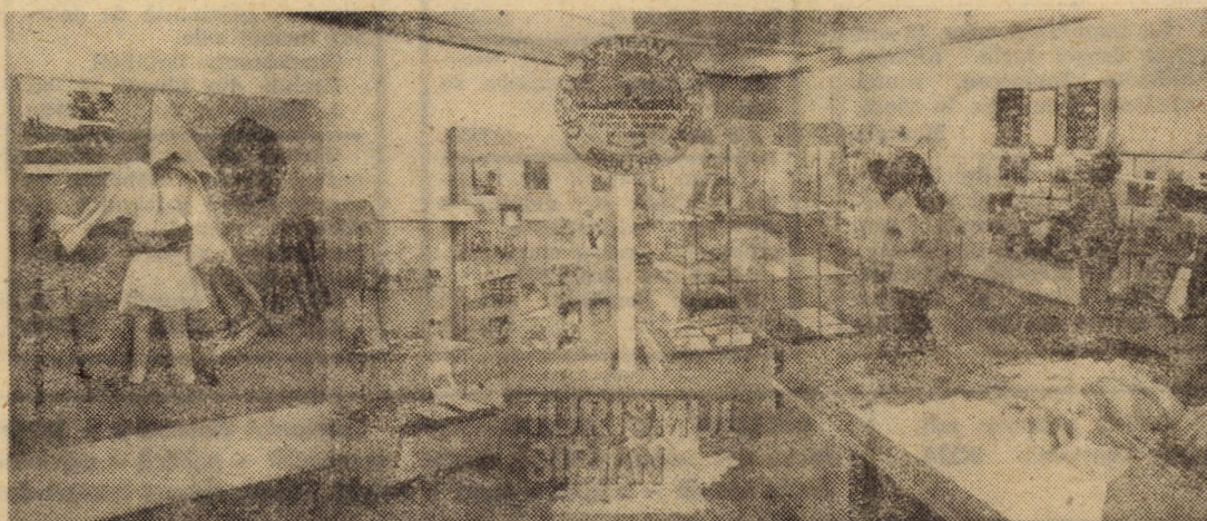
Imagine de la expoziția „Turismul sibiian”