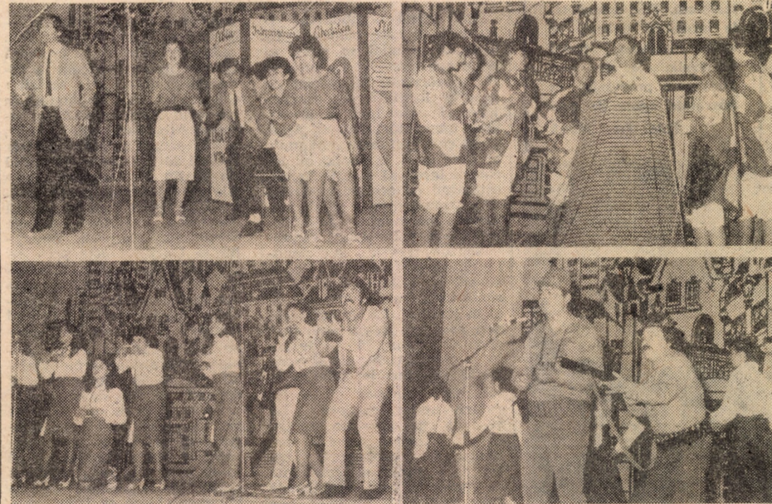
Secvențe din spectacolul-concurs al brigăzilor artistice de amatori din întreprinderile ramurii industriei ușoare, desfășurat recent la Sibiu

Județul nostru a fost bine reprezentat și de această dată de brigada artistică a întreprinderii „13 Decembrie”, care a ocupat locul I, brigada artistică a întreprinderii „Libertatea” (locul II), brigada artistică a întreprinderii „7 Noiembrie” (locul III) și brigada artistică a întreprinderii „8 Mai” din Mediaș (mențiune).