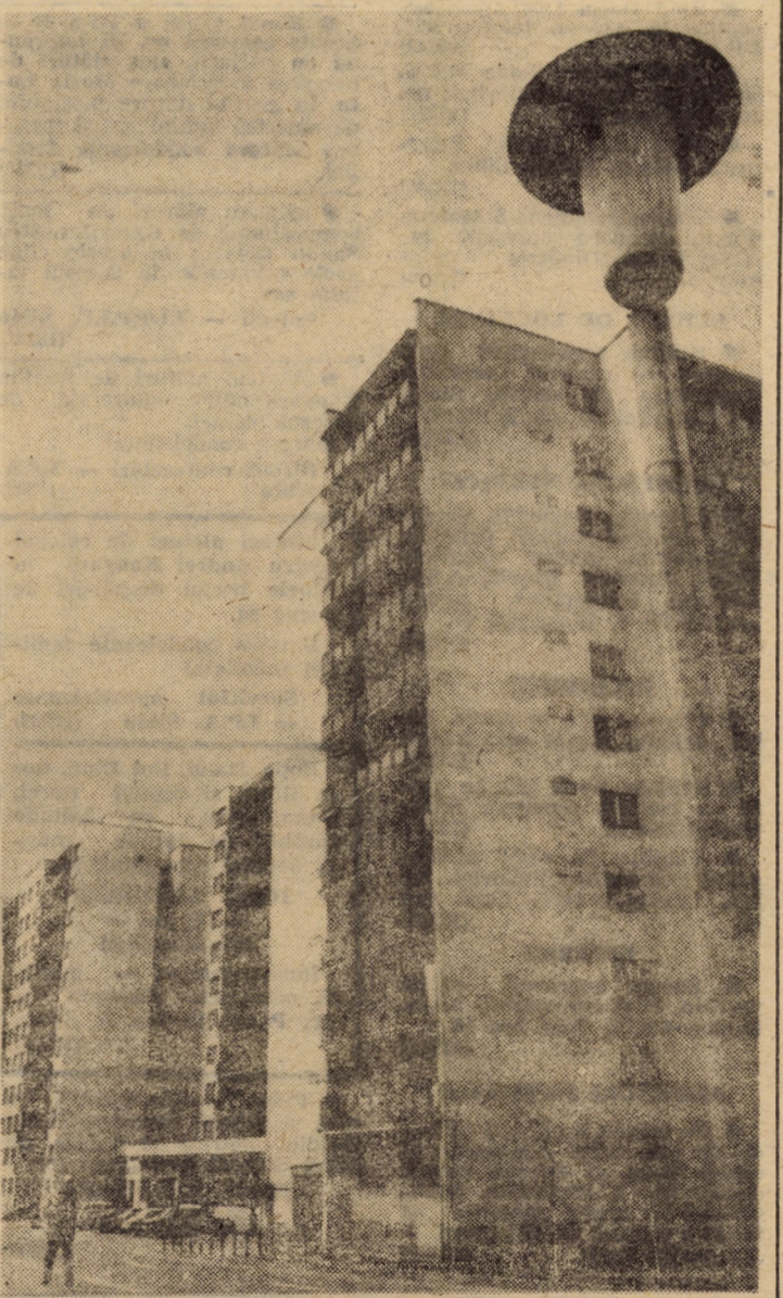
Geometria pe verticală a blocurilor de locuințe din cartierul „Gura Cimpului” constituie o dovadă elocventă pentru perioada de dezvoltare fără precedent prin care a trecut municipiul Medias, asemenea tuturor orașelor țării, în anii care au trecut de la Congresul al IX-lea al partidului.