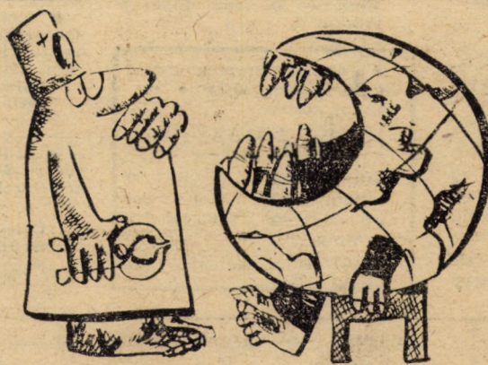
Desen de Adrian POPESCU