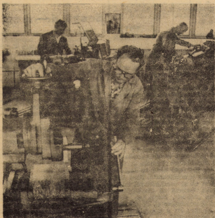
Atelierul de sculărie — prototipuri al cooperativei „Tehnica nouă” din Sibiu, intrat în funcțiune la începutul acestui an, dispune în prezent de o bună dotare tehnică și de un colectiv cu pregătire profesională corespunzătoare, asigurînd întreaga gamă de S.D.V.-uri necesare tuturor unităților cooperativei.

(Continuare în pag. a III-a) Constantin BOTA