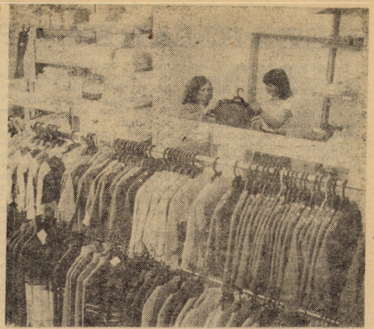
Vedere parțială din interiorul magazinului, găzduit la parterul blocului nr. 51 din cartierul sibian „Valea Aurie”. Unitatea, deschisă cu cîteva luni în urmă, este specializată în articole pentru nou născuți și copii

Revenind la modul cum s-a acționat pentru a sprijini unitățile în reducerea stocurilor, precizăm că din cele 94 milioane lei materiale ce pot fi redistribuite, B.J.A.T.M. Sibiu a comandat materiale în valoare de 70,5 milioane lei și au fost aduse efectiv în bază cantități ce au o valoare de 67,3 milioane lei, care apoi în luna august a ajuns la 84 milioane lei, reprezentînd materiale valorificate, provenite de la unitățile din județ sau din propriile stocuri. Ceea ce mai poate face acum B.J.A.T.M., este să preia materiale din stocurile unităților industriale doar cînd a găsit o altă unitate beneficiară.