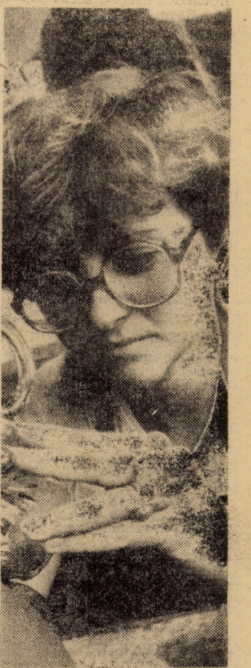
Mulți dintre tinerii de la „Vitrometan” Medias, au îmbrățișat frumoasa meserie de sculptor, executînd azi adevărate lucrări de artă din cristal

Concluzia de bază a investigațiilor noastre este că, la Medias, activitatea de educație patriotică, de formare a spiritului revoluționar, de creștere a conștiinței socialiste a comunistilor este tratată cu toată responsabilitatea. Pornind de la recunoașterea existenței încă a unor deficiențe și neîmpliniri, biroul Comitetului municipal de partid a adoptat, în cadrul unei recente analize, un riguros plan de măsuri menit a ridica această activitate pe coordonatele noii calități și a unei eficiențe sporite. Există convingerea că, prin munca politică trebuie să se facă mai mult pentru cunoașterea și generalizarea la nivelul fiecărui colectiv din municipiu a experiențelor pozitive, valoroase, înaintate, mijlocind astfel transferul operativ de experiență și valori în domeniul formării și dezvoltării conștiinței muncitorești revoluționare, înaintate.