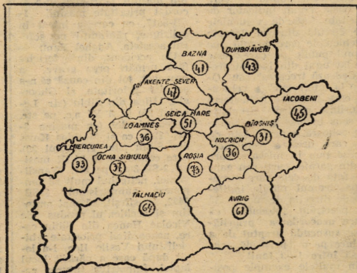
Stadiul executării arăturilor pentru însămînțările de primăvară — în procente — în consiliile unice agro-industriale, la 7 noiembrie a.c.