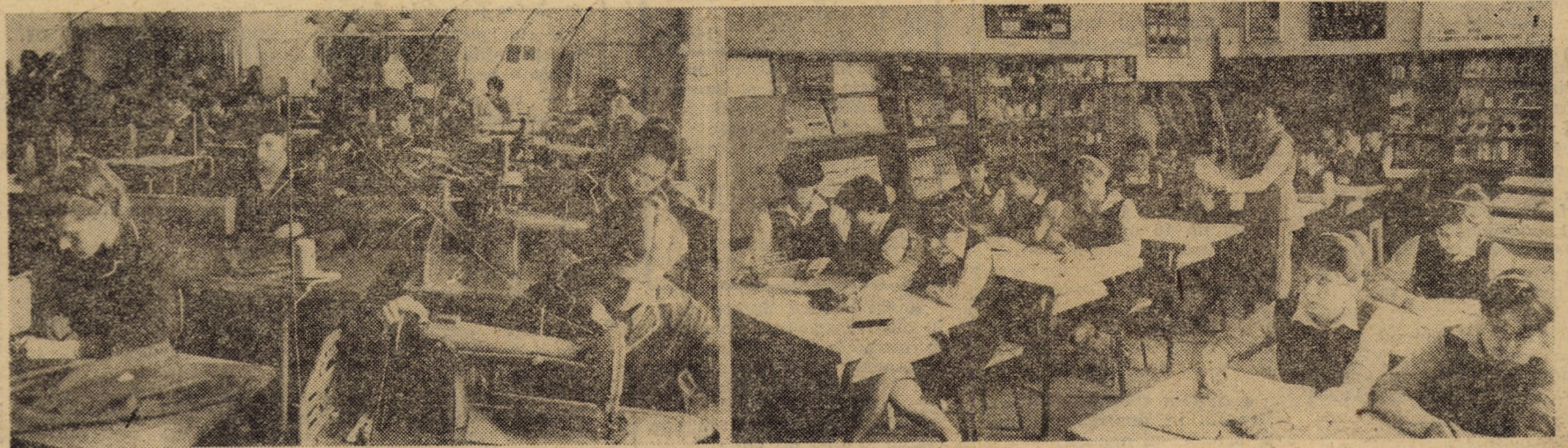
Atelierul confecții-țesături al Liceului „7 Noiembrie” Sibiu

Pagină realizată de: Angela POPESCU