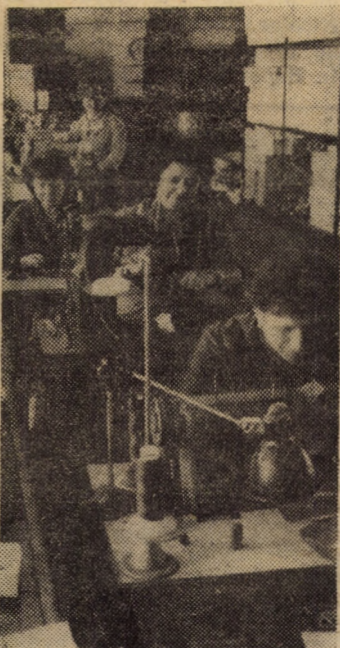
La una din benzile de lucru din secția creație a Fabricii de încălzăminte „8 Mai“ Mediaș.