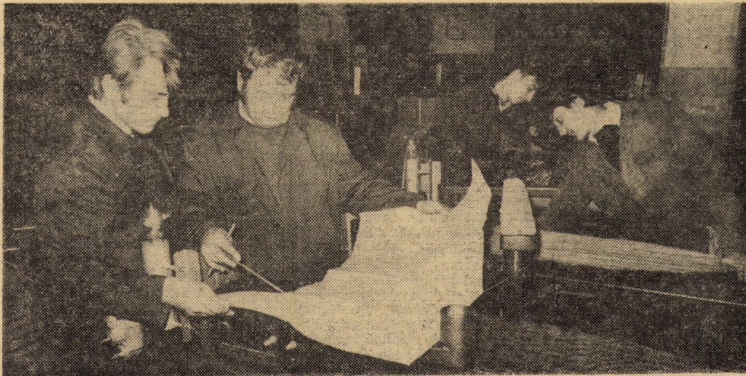
În atelierul montaj H.P. 2 al Fabricii de elemente hidropneumatice, întreprinderea „Balanța” Sibiu, se finalizează un lot de instalații pentru călcat și finisat, utilaje destinate industriei confecțiilor. Primul beneficiar al acestor produse a fost întreprinderea de confecții „Steaua roșie” Sibiu

Tineri și tinere! Pentru viitorul nostru, pentru viitorul omenirii, pentru pace în lume — un DA unanim la referendumul de la 23 noiembrie!