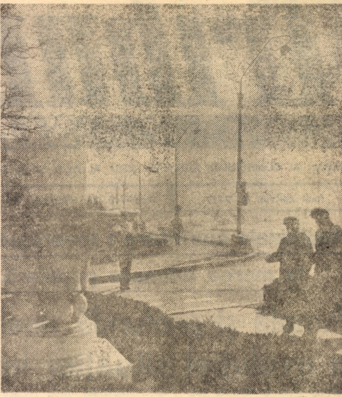
„E-o muzică de toamnă Cu glas de piculină, Cu note dulci de flaut, Cu ton de violină...“