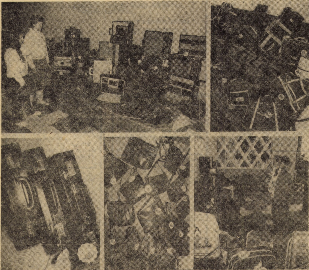
Imagini surprinse în Expoziția de creație a articolelor de marochinărie

mărturisită ca în anul 1987 unitatea să ocupe un loc fruntaș în zootehnia județului. Pregătirile pentru îndeplinirea acestui obiectiv sînt în curs de desfășurare. Au fost identificate și lotizate toate vițelele ce vor intra în efectivul de vaci, care sînt furajate în acest scop, și urmăriți zi de zi. Se construiesc spațiile necesare unei activități corespunzătoare. Se pregătesc de pe acum producțiile viitoare de furaje. A început și trerea oamenilor. Fiecărui îngrijitor-mulgător i s-a dat în primire un efectiv de 22 de vaci și juninci. Li s-a explicat cu claritate că de felul cum vor pregăti junincile pentru lactație depind câștigurile lor viitoare. Felul cum a demarat acțiunea a întărit încrederea oamenilor în posibilitățile de câștig existente în zootehnie. De pe acum la consiliul de conducere s-au primit cereri pentru activitatea de îngrijitor-mulgător. „E un semn bun — ne spune în încheiere președintele cooperativei —, oamenii au încredere în noi și noi vom face tot ce ne stă în putință pentru a le crea toate condițiile pentru realizarea indicatorilor de plan și, concomitent, a unor câștiguri consistente”.