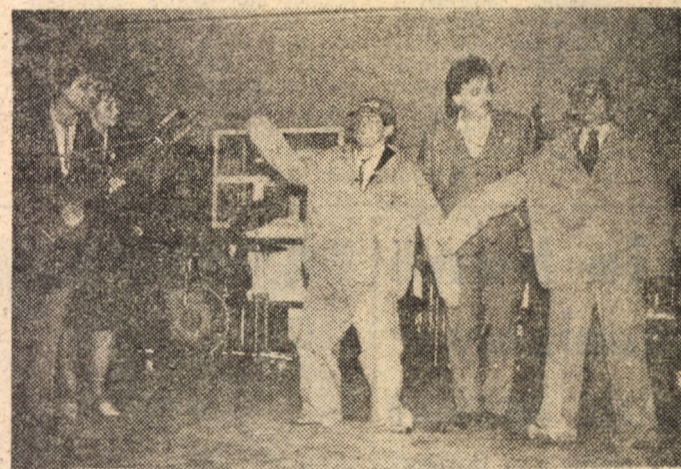
Moment din spectacolul brigăzii artistice de la „Balanta” Sibiu

Momentul de vîrf al manifestării l-a constituit organizarea și desfășurarea unui concurs de elaborare a textului pe teme date și prezentate, după o oră, a unui spectacol de brigadă. Acest test a scos în evidență largile disponibilități creatoare și interpretative ale componenților brigăzilor artistice participante, capacitatea lor de a reacționa rapid la comanda socială, posesia unui larg registru de mijloace adecvate pentru înțocmirea unui text și realizarea rapidă a unui spectacol de brigadă. Disputa, foarte pasionantă, a dat cîștig de cauză brigăzii artistice de la I.J.G.C.L. Sibiu, situată pe locul I, care a reu-