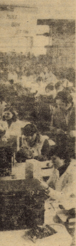
Una din liniile de producție ale secției montaj de la întreprinderea de relee Mediaș