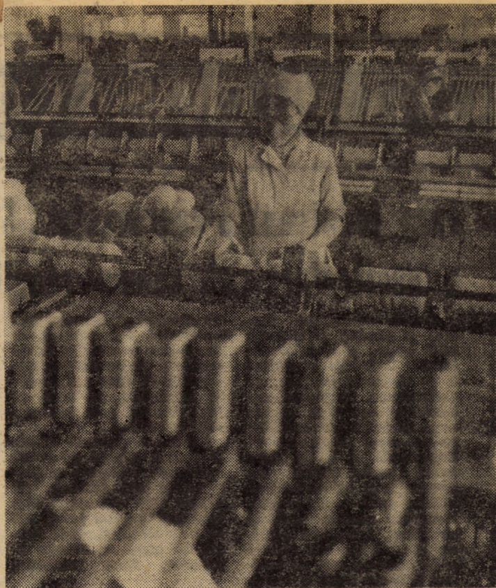
Vă redăm o imagine din secția filatură a întreprinderii „Libertatea” din Sibiu. În prim plan: lămoare de înaltă productivitate

vacă, 165 hectolitri lapte de oaie și 5910 kg lînă. Singurele poziții de plan cu restanțe la data menționată erau carnea de porcine (nerealizată de 0,6 tone) și laptele de vacă (nerealizată de 667 hectolitri). Diferența la porcine se preconiza să fie lichidată rapid, materialul biologic care făcea obiectul contractelor fiind pregătit pentru livrare. O situație mai delicată, după cum evidențiază cuantumul nerealizării, este la laptele de vacă. Motivațiile care au de-