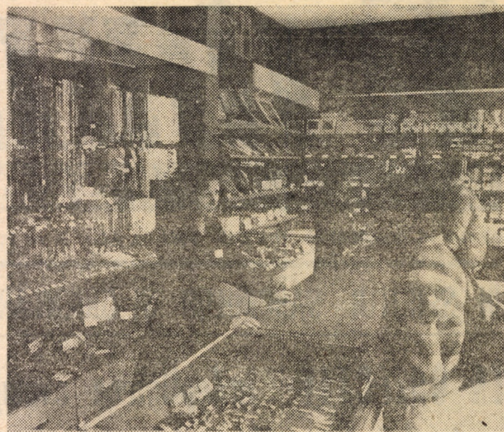
Vă redăm o imagine din interiorul magazinului nr. 160, specializat în articole de bijuterie, ceasuri, foto și muzică, deschis recent în cartierul Hipodrom III din Sibiu