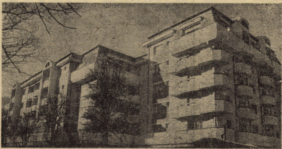
Noile blocuri de locuințe, ridicate recent pe B-dul Victoriei din Sibiu, se remarcă printr-o arhitectură deosebită. În imagine — blocul construit în regie proprie de întreprinderea „Steaua roșie” Sibiu.

● Apărarea secretului de stat — importantă cerință legală, îndatorire patriotică a fiecărui cetățean (În pagina a III-a)