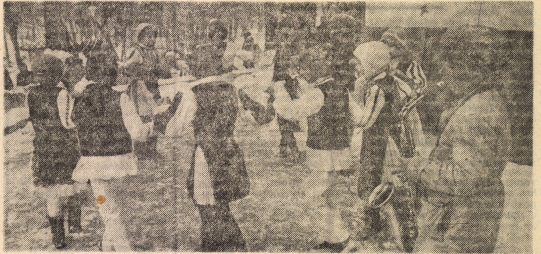
Moment folcloric pe scena din „Orășelul copiilor” din parcul „Sub arini”