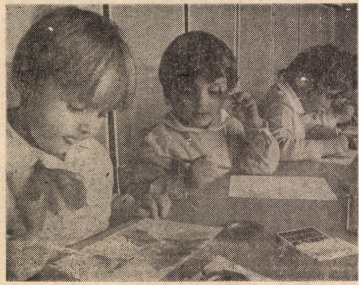
Moment de „creație” într-o oră de desen la grădinița I.J.T.L. de pe strada Siretului din Sibiu