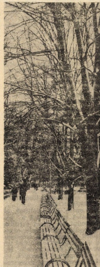
Parcul „Astra” din Sibiu, din nou sub hlamida zăpezii