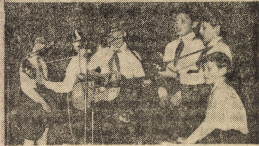
Imagini de la spectacolul festiv desfășurat la Sibiu, dedicat aniversării zilei de naștere și omagierii îndelungatei activități revoluționare a secretarului general al partidului, președintele României, tovarășul Nicolae Ceaușescu