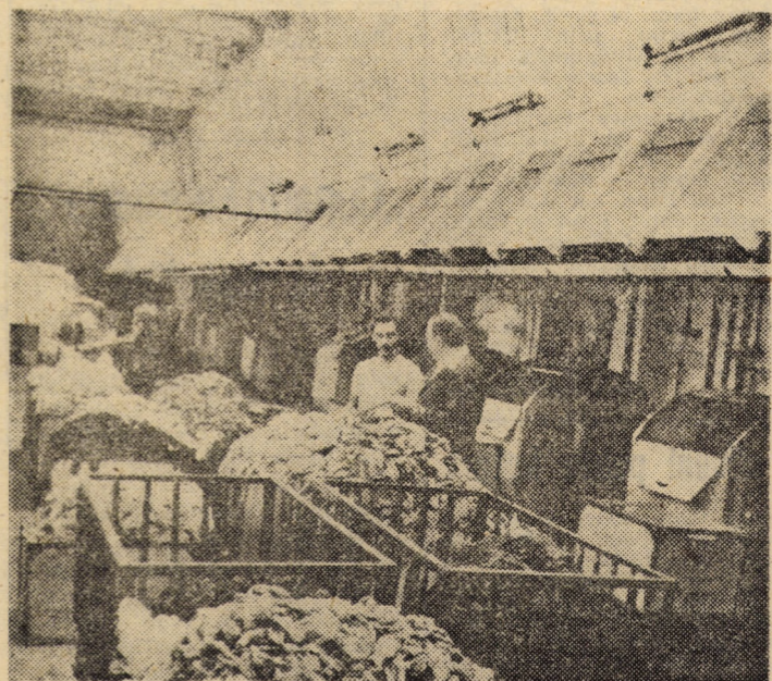
In secția vopsitorie a sectorului II finisaj de la „7 Noiembrie”, Sibiu — de unde vă redăm o secvență de lucru — se prelucrează zilnic peste 50 000 perechi ciorapi din fire de bumbac și supraelastice

cesteia, pe seama înnoirii și aplicării tehnologiilor avansate. Cunoșcând realizările în acest domeniu, precum și unele neajunsuri manifestate, în fața organelor și organizațiilor de partid, a consiliilor oamenilor muncii din întreprinderi stau sarcini deosebite în acest an. Pe lângă faptul că măsurile stabilite trebuie revăzute, programele