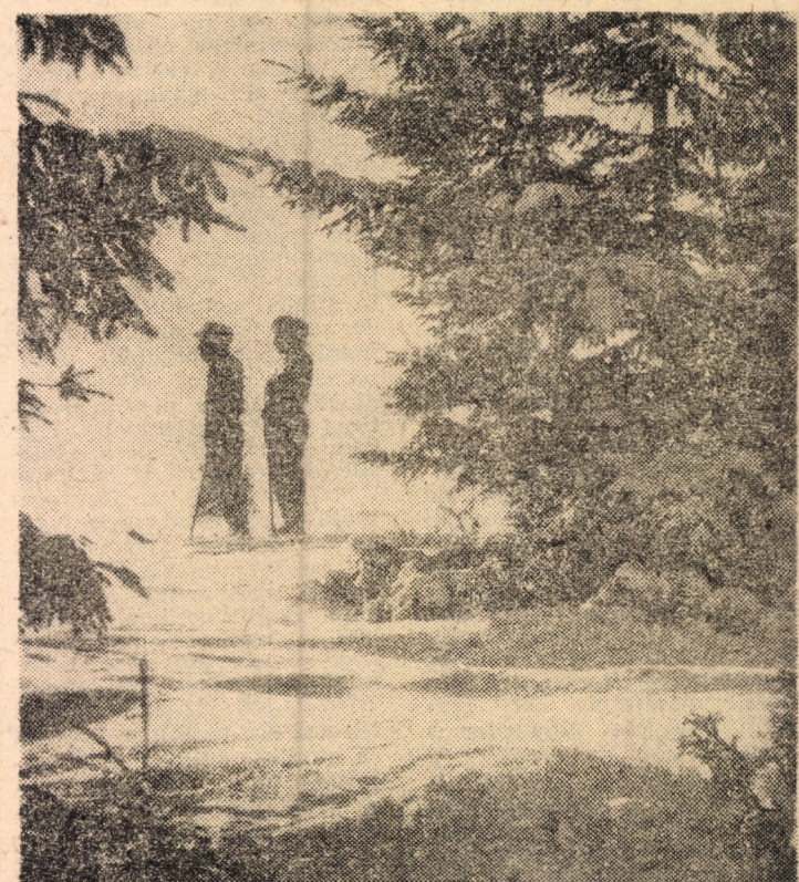
Decor hibernal in peisajul stațiunii Păltiniș